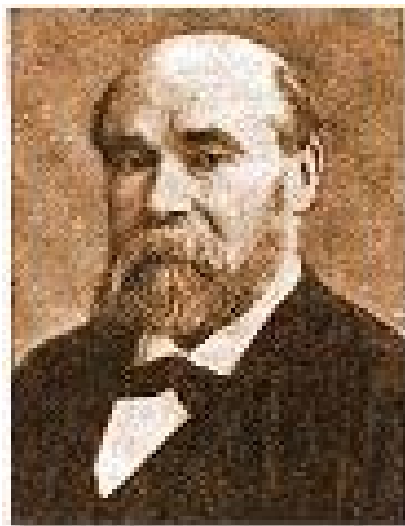
Paul Féval (père)